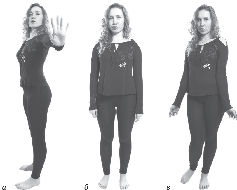
Рис. 3. Три варианта применения жестов по полоролевому принципу для женщин. Отторжение. Нейтральный. Привлечение

Кстати, расслабленные губы — это само по себе очень хорошо. И для здоровья, и для благоприятных коммуникаций. Поэтому в этом случае не ограничивайте себя. В книгах «3 женских счастья» и «Кто вы в жестах: мужчина или женщина?» я подробно описал упражнения для формирования прекрасного абриса губ.