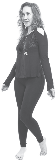
Рис. 4. Ограничение системы жестов. «Три жеста женского счастья»: наклон головы влево, припухлые, капризные губы, чуть отставленный таз

Следующий важный момент. Все рекомендации моей системы в вопросах взаимодействия мужчин и женщин применяются только при полороловом поведении, то есть, при заинтересованном общении женщины с мужчиной.