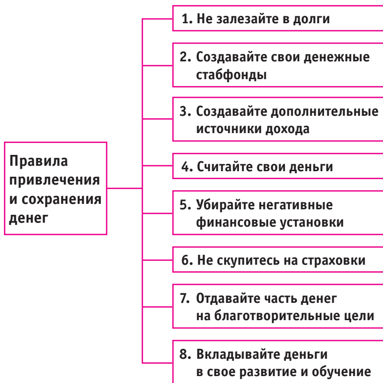
Рис. 6. «Правила денег»

Мы познакомились с теоретической базой, знаем теперь, с чем и над чем работать. Остается ответить на вопрос, как работать. Об этом и пойдет речь в следующих главах. Я научу вас очень эффективным техникам, которые помогли уже многим людям изменить свою жизнь. Уверен, помогут они и вам! Поехали!