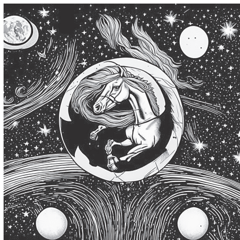
Рис. 3. Сферический конь в вакууме. Нейросети Retomagic и Кандинский