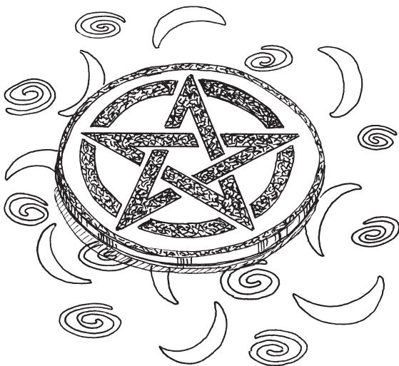
Керамический пентакль с пентаграммой посередине