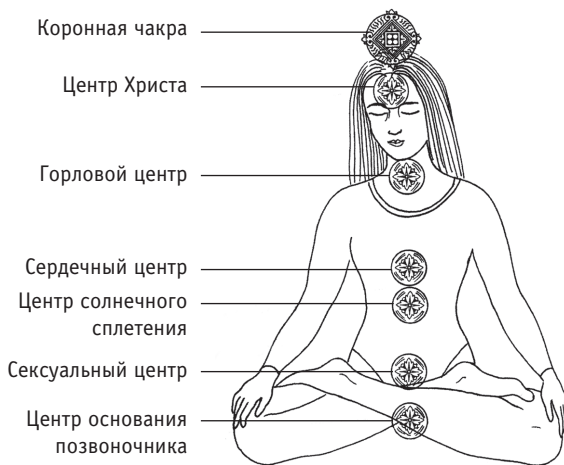
Рис. 2. Семь основных экстрасенсорных центров

Чакры круглосуточно оказывают непосредственное влияние на то, как мы ощущаем себя, подозреваем мы об этом или нет. Постоянная циркуляция энергий, которая происходит в энергетических центрах и каналах, связанных между собой, определяет наше духовное развитие. Любые застойные явления в этом потоке, скорее всего, будут блокировать наше экстрасенсорное