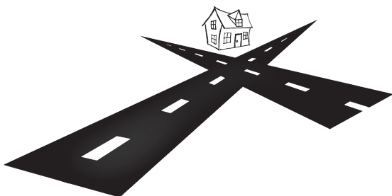
Рис. 13. Перекресток

Дом, расположенный на перекрестке, со всех сторон подвергается быстрым пересекающимся потокам энергии, которую могут отразить кристаллы. Для этого камни нужно разместить снаружи или внутри дома, рядом с входной дверью. Если энергия проносится мимо дома — вдоль главной дороги — расположенный снаружи кристалл при необходимости замедлит и гармонизирует ее поток.