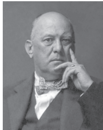
Алистер Кроули

Венера также ассоциируется с деньгами, любовью и красотой; отсюда следует, что Кроули обладал утонченным вкусом и с легкостью тратил деньги на произведения искусства, красивую одежду и предметы. Что касается денег, по крайней мере во время учебы в Кембридже он мог не волноваться: при жизни родителей он был хорошо обеспечен, а после смерти отца получил солидное наследство.