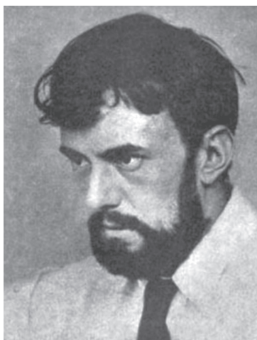
Алистер Кроули, Цейлон (ныне Шри-Ланка), 1901

Эдвард Александр Кроули (широкой публике более известный как Алистер Кроули) родился в религиозной зажиточной семье в городке Ройал-Лемингтон-Спа, что в английском графстве Уорикшир, 12 октября 1875 года. Умер 1 декабря 1947 года в возрасте 72 лет. Его отец (которого также звали Эдвард) родился в 1834 году и получил образование инженера-строителя. Однако по профессии он ни дня не работал, предпочтя «жить