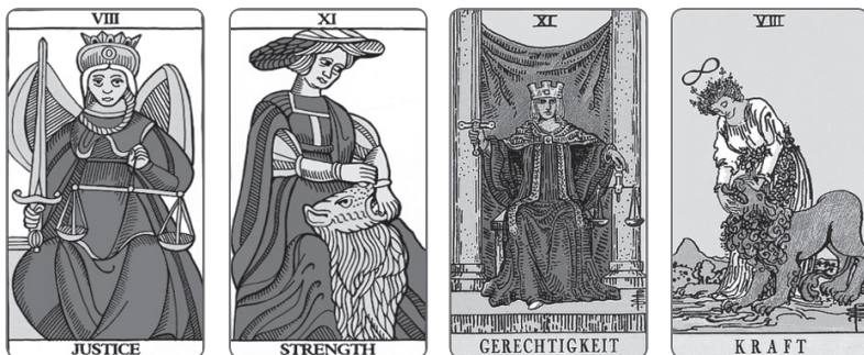
Традиционная нумерация в Марсельском Таро