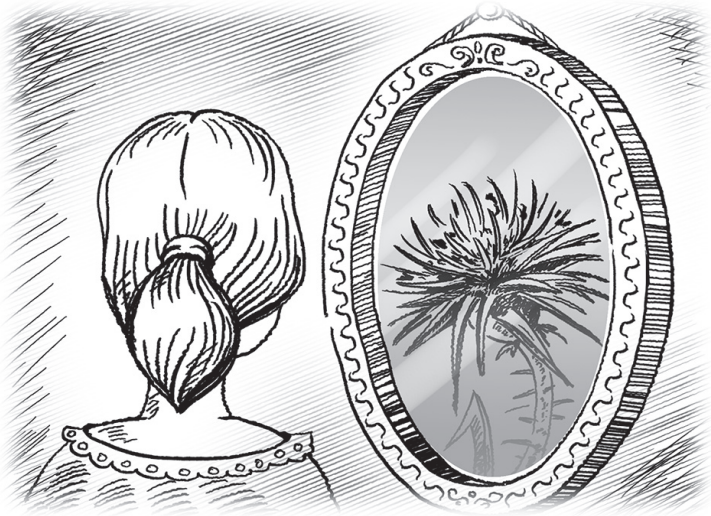
Рис. 2. Зеркало для Любы

ла в гостях, нарушая тишину и досаждая хозяевам. После ее визита приходилось убирать, исправлять и чистить вещи в доме. Как благовоспитанные люди, взрослые не делали замечаний гостю, не высказывали своего мнения явно, понятными ребенку словами. Это не принято, ведь люди стараются не обидеть того, кто пришел к ним в дом.