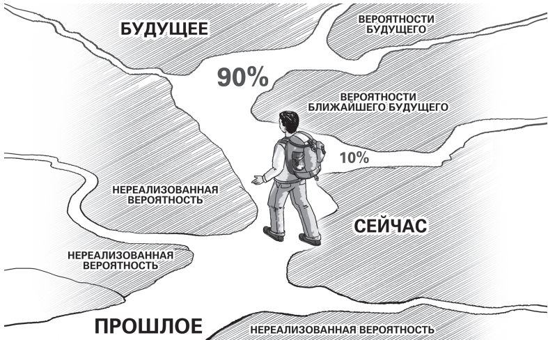
Рис. 1. Дорога жизни

свою карму. Дорога жизни (рис. 1) имеет ответвления, маленькие тропинки, отходящие в стороны от основного, очевидного пути. Это те самые возможности, которые могут изменить кармическое будущее.